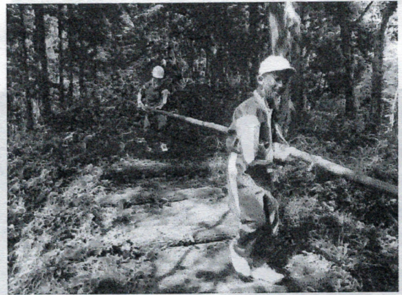
竹を切り運び出す