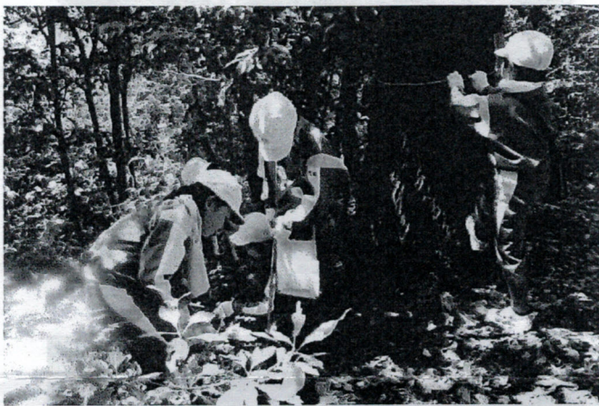
クヌギの根元で昆虫を探す