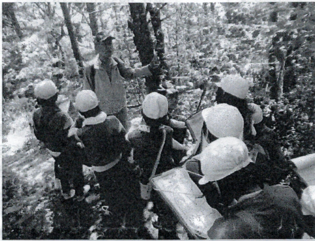
森の植物について話を聞く