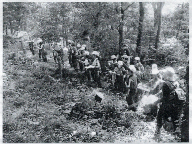
いろんな植物を見つけて調べる