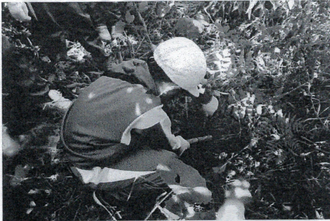
植樹した苗の周辺の草刈り