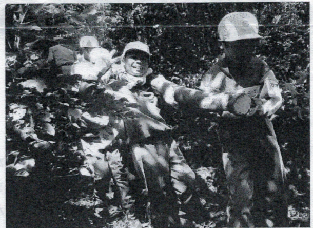
伐採した木を運びだし切断して薪を作る