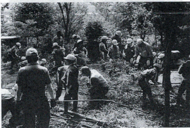
竹を短く切り、キンラン調査用の目印を作る