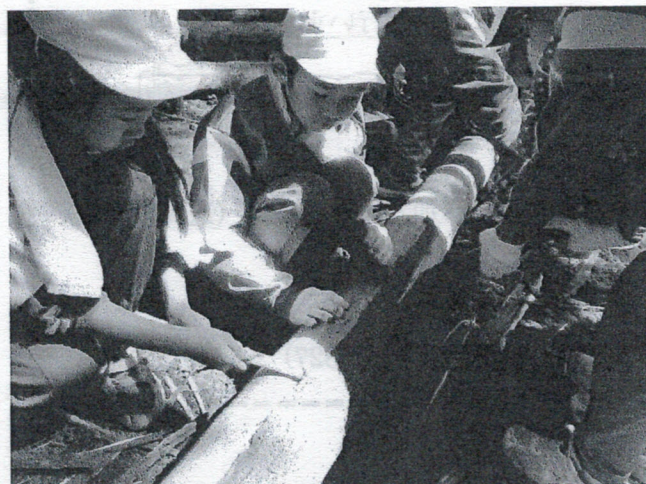
スギ・ヒノキの皮むき