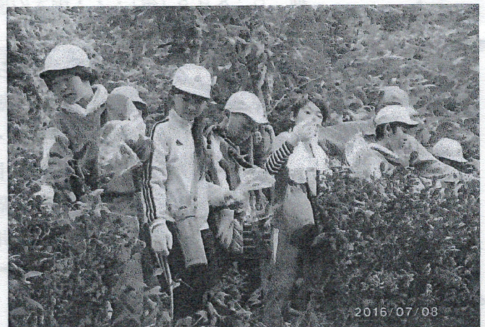
森の周辺の茶摘み