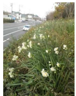
道路上側のスイセン