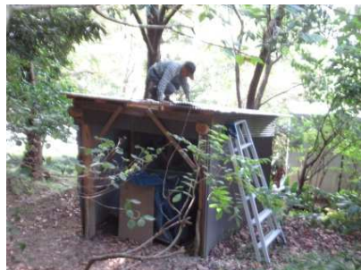
運搬車小屋の屋根修理