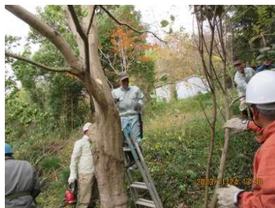
水道路に張出した樹木の伐採