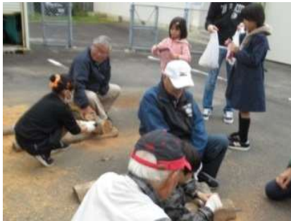
丸太切りをする子ども達