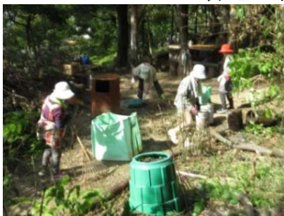
休憩所周辺の整備